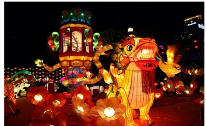
Lễ hội Rước đèn ( Trung thu)