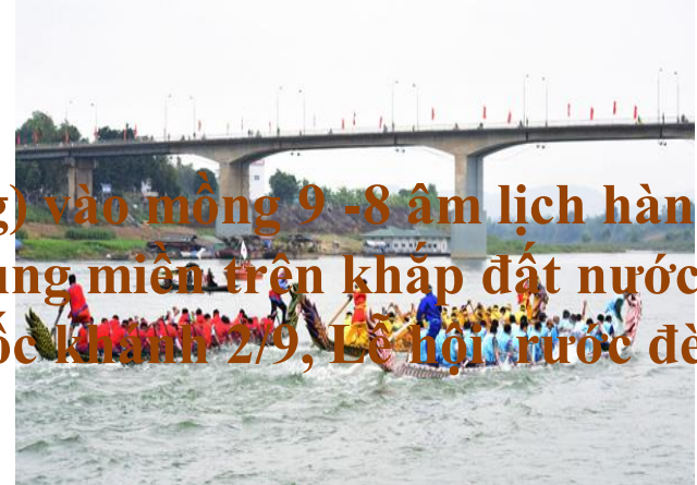
Lễ hội đua thuyền