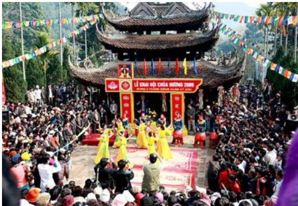
Lễ hội chùa Hương